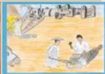
Lehen Hezkuntza: 2. zikloa Aitziber Castañós